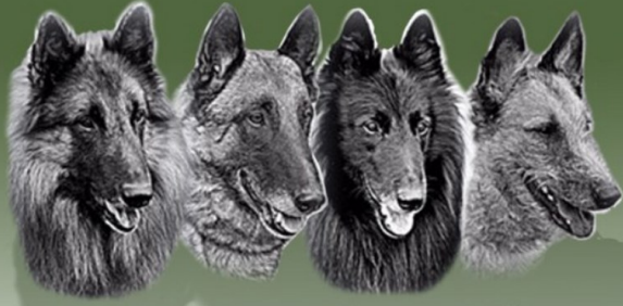
Tervueren - Malinois - Groenendael - Laekenois Tervuren - Mechelaar - Groenendaler - Laekense

Koninklijke Unie der Clubs voor Belgische Herdershonden vzw Union Royale des Clubs de Berger Belges asbl